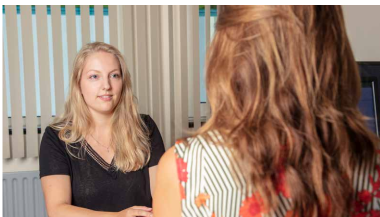
Gesprek met de huisarts.