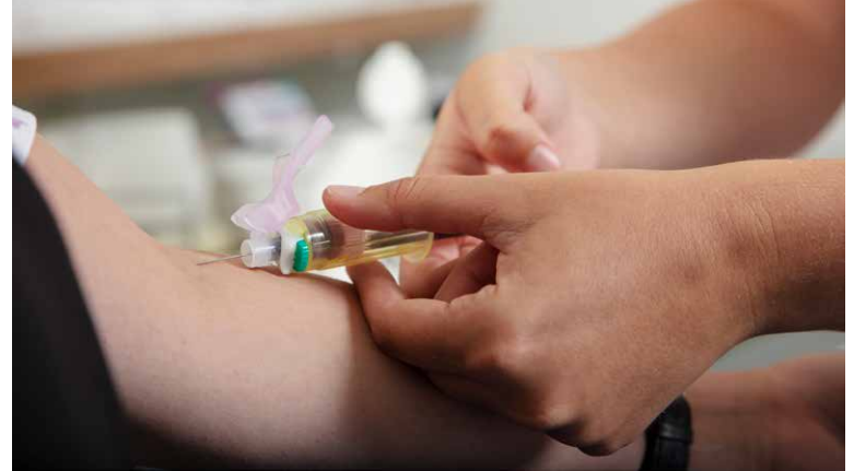
Bezoek aan de Diagnovum-prikpost.